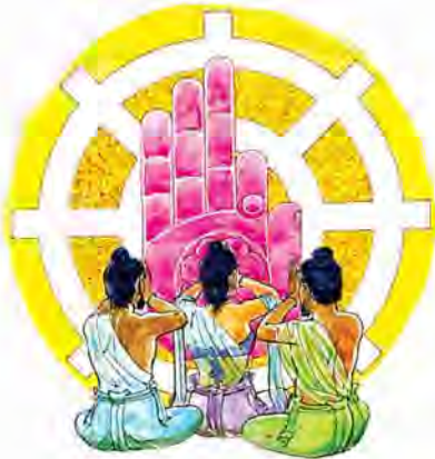
විචිත්ද නිරෝමණි වෛද්‍යරත්න

ඇත්ත හමුවේදී මලක් මෙන් මෙලෙක් වෙමි ඇත්ත නැත්ත දෙසුමි හමුවේ ගලක් මෙන් දැඩි වෙමි කුසිනව පසු බවට පසුබානුයේ කුමකට සිහි කල්පනා ඇතිවම නිර අදියරන පෙරටු කොට යම් තවත් ඉදිරියට