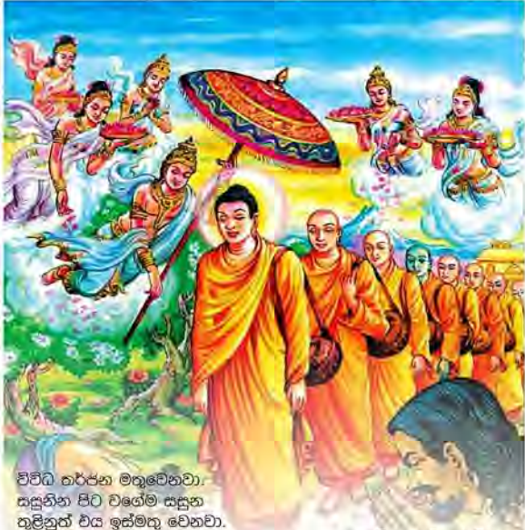
විවිධ තර්ජන මතු වෙනවා. සසුනින සිට වගේම සසුන තුළින් වය ඉස්මතු වෙනවා.

නිකුණුවට සමාජ කාර්යභාරයක් තියෙනවා. සමාජ වගකීමක් තියෙනවා. සමාජ නායකත්වයක් තියෙනවා. මේ සමාජයෙන් වය ඉවත් කිරීමට ගන්නා උත්සහය හරිනිසොත් ගෙවර්ග ගණනක් ඉපැරණි අපේ උරුමයටත් ජාතියේ පැවැත්මටත් තර්ජන මතු වේවි. මේ රටේ උරුමය හොඳ නැතුවත් තනසිවීර මුල්කරගෙනයි. ඒ වගේම ග්‍රාමවාසී සුපේෂල ශික්ෂාකාරී හිමිවරුන්ට වරෙන්ඩ්වත්