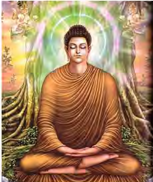
“පරුක්වේ හඳු සම්පතට කෙරෙහි කරුණා” (අනුන්ට දුකක් ඇති වූ පන්පුරුද්දකින් හැටුණ කම්පනය කෙරෙහිම කරුණා නම් වෙයි)