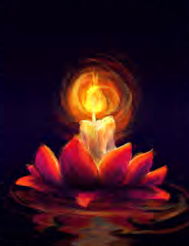
හමුවුයේ උපනිස්ස පිරිවැප්ටය. එම අවස්ථාවේදී අස්සප් භාමුදුරුවන් වහන්සේ දේශනා කළේ.

සැරියුත් මුගලන් යන අගුණාවක යන දෙනම ගිහි කළ උපනිස්ස කෝලිත නම් විය. ගිහි ජීවියන ගැන කලකිරීමෙන් විමුක්තිය සොයා ගිය එම දෙපලගෙන් පළමුව අස්සප් මහ රහතන් වහන්සේ